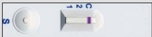
Negatívny výsledok testu