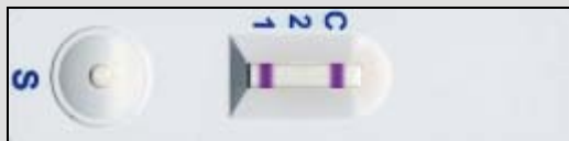
Pozitívny výsledok testu na genoskupinu 1