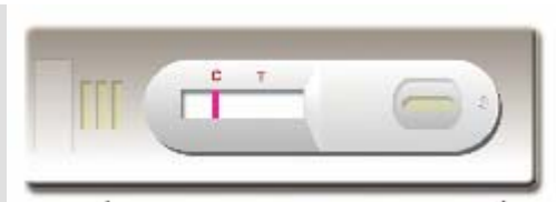
Negatívny výsledok testu